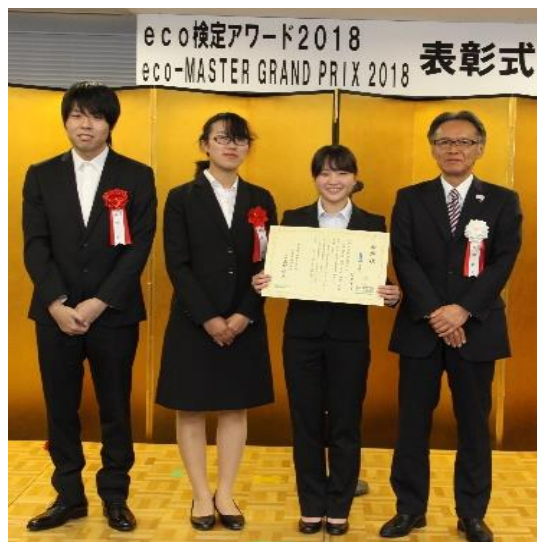
受賞した学生さん(左 3 名)

岐阜大学の ISO の認証対象となる構成員は 2300 名ほどの教職員ですが、大学で一番多い 7300 名以上の学生の存在も大きく、準構成員と考えています。教職員には年度当初に周知カードの配布・記入、講習会、年に 3 回の再確認シート提出などで意識向上を図っています。学生にも ISO の認証取得、「環境ユニバーシティ」宣言の周知をリーフレットの配布、ガイダンスなどで行って意識を高めています。また、環境に関する講義、東京商工会議所主催 eco 検定受験希望者へのサポート、ISO 内部環境監査にも有志ですが教職員と一緒に事前研修の後、参加を通して、環境マインドをもった学生を輩出することを目指しています。本年度、eco 検定チーム戦「eco-MASTER GRAND PRIX 2018」学生部門第 2 位入賞、「eco 検定アワード 2018」エコユニット部門奨励賞を受賞することができました。本学の環境への取り組みについては、検索サイトで「岐阜大学」「環境対策」でヒットする「岐阜大学環境対策室」のホームページならびに掲載の「環境報告書」をご覧ください。